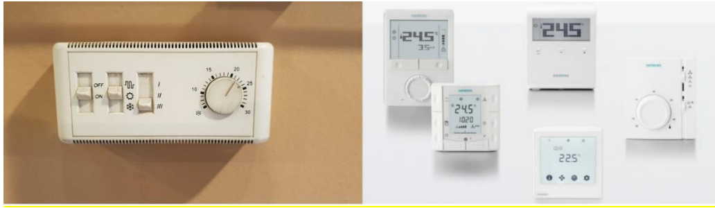
Para dhe pas