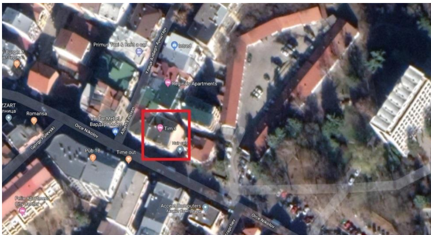
Vendndodhja e Hotelit TIM'S në rr. Orce Nikollov nr. 120